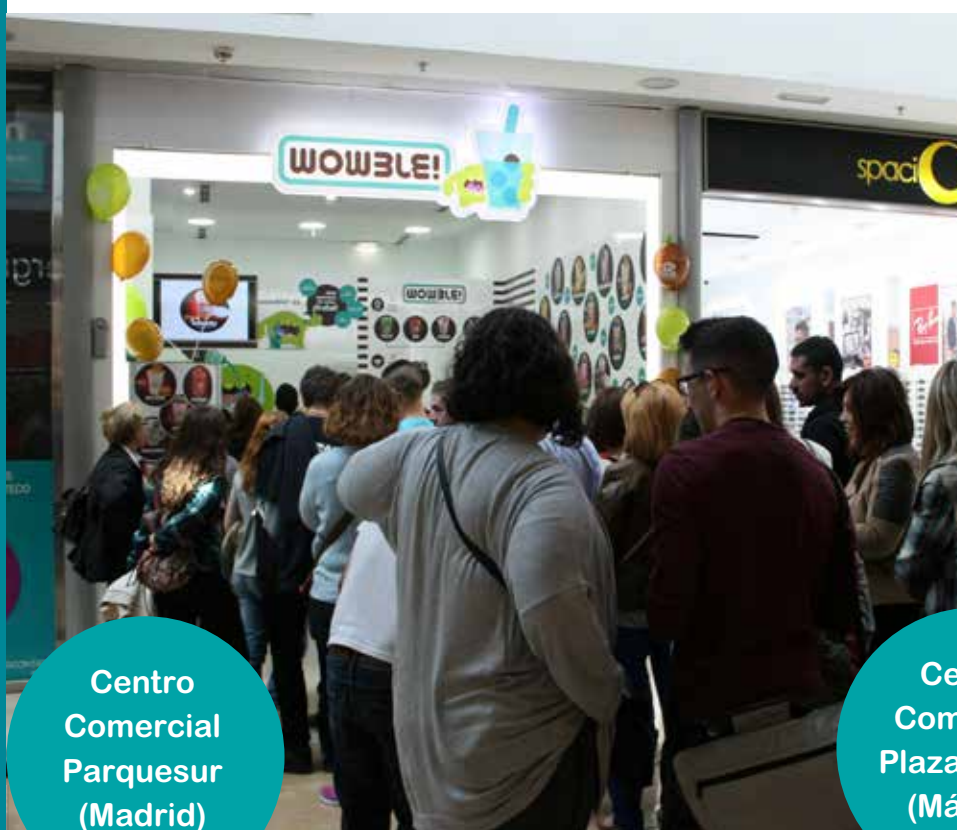
Centro Comercial Parquesur (Madrid)