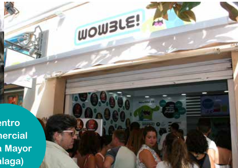
Centro Comercial Plaza Mayor (Málaga)