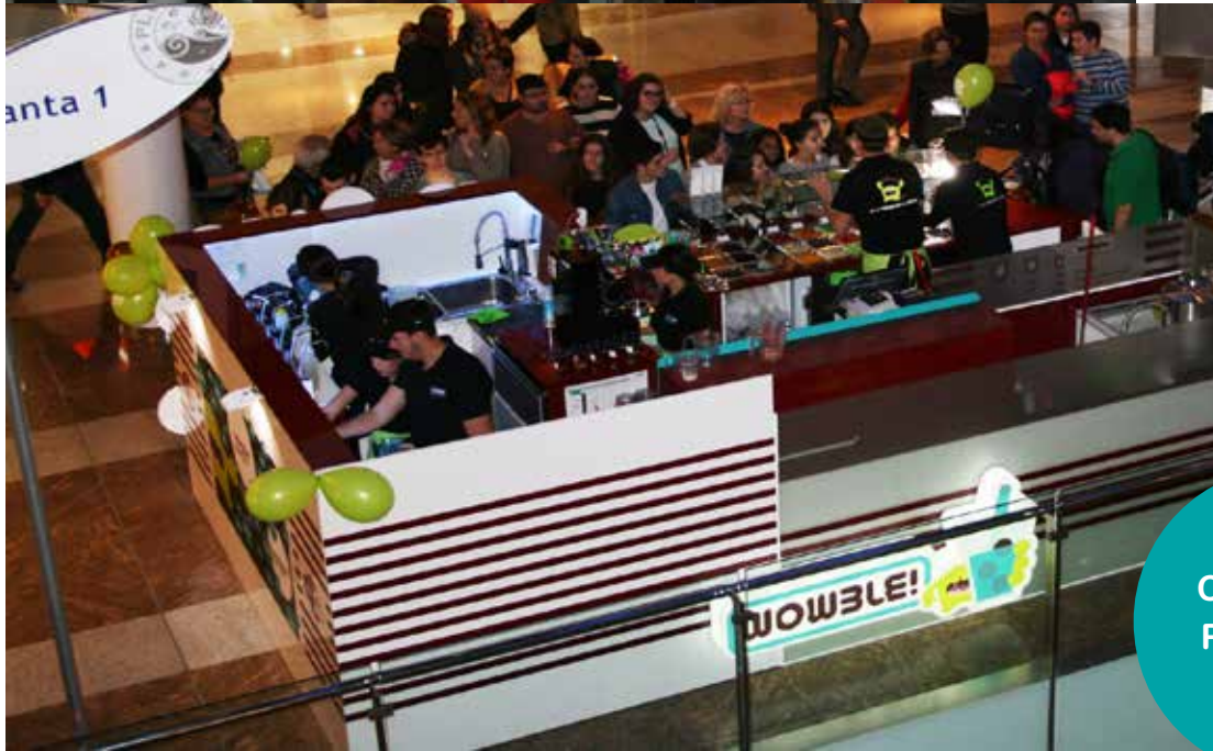
Centro Comercial Plenilunio (Madrid)