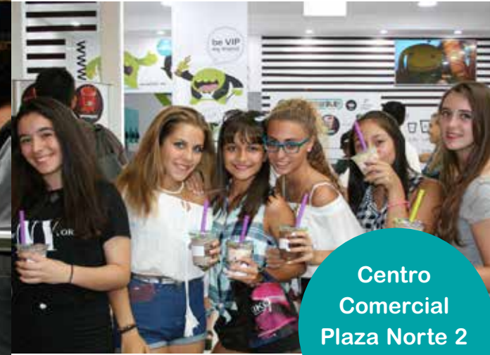
Centro Comercial Plaza Norte 2 (Madrid)