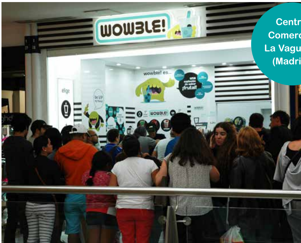
Centro Comercial La Vaguada (Madrid)